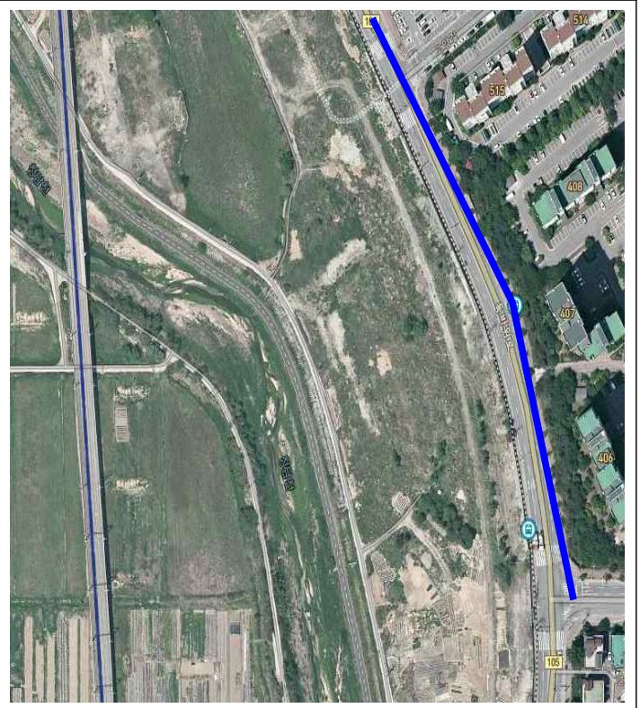
※ 읍보아파트 및 청담천과 제방도로 및 도로(회천1동), 하천건너편 주공아파트5단지 라인(회천3동)