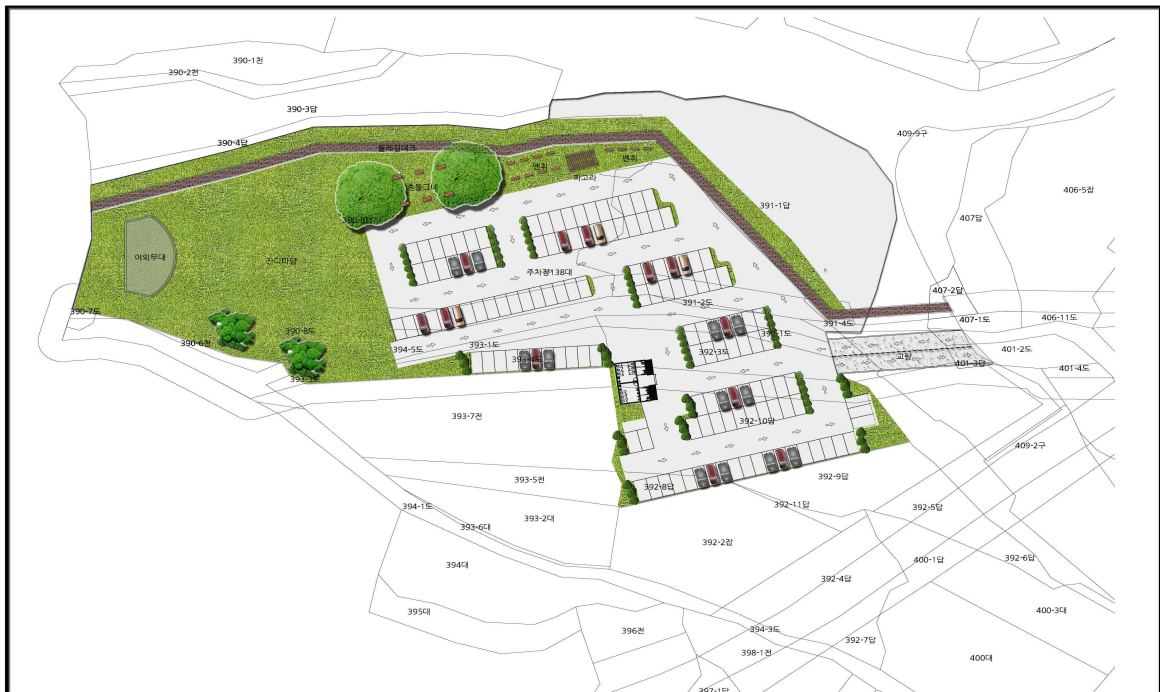
편의시설 설치 조감도