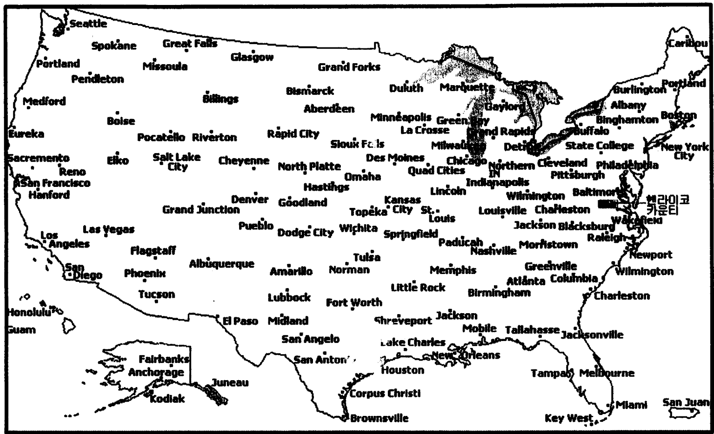
미국 버지니아주 헨라이코 카운티 위치도