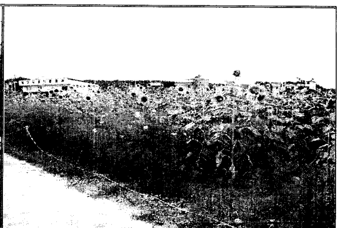
【 농협앞 해바라기꽃 밭】