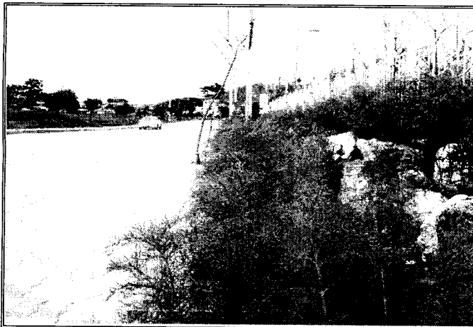
【 양주백석고앞 해바라기·코스모스모스 길】