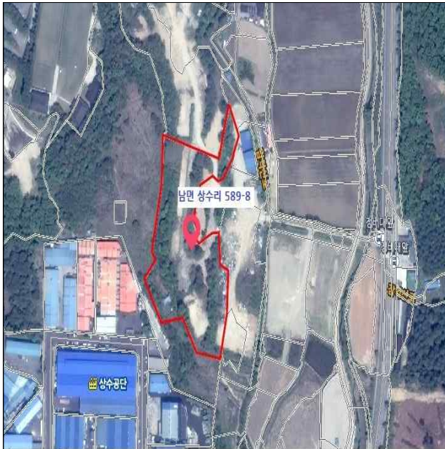
[처분] 남면 상수리 589-8(25사단 주둔)