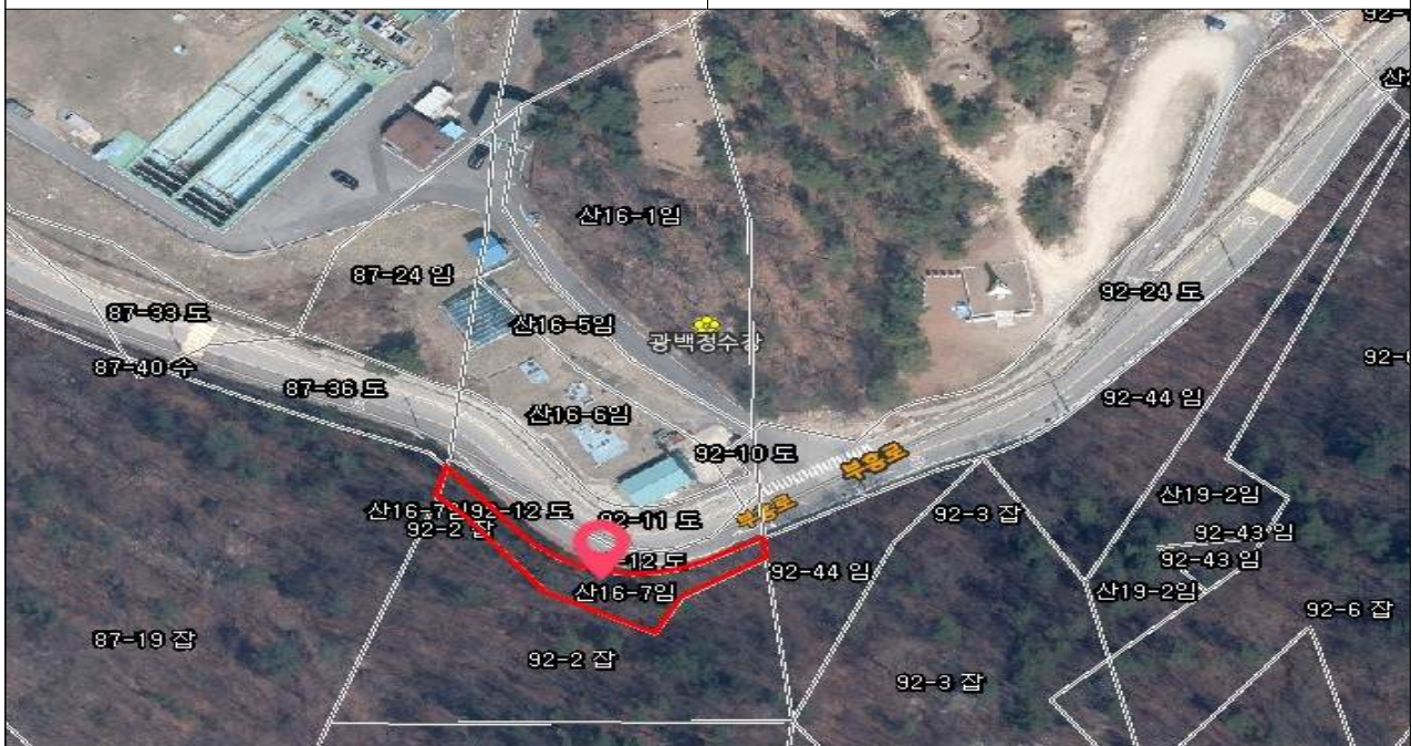
[처분] 백석읍 방성리 산16-7(8사단 주둔)