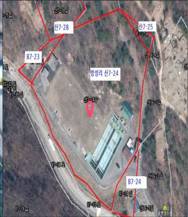
[취득] 백석읍 방성리 일원(광백정수장부지)