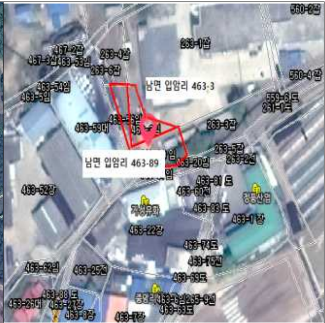
[처분] 남면 입암리 463-3,89(28사단 주둔)