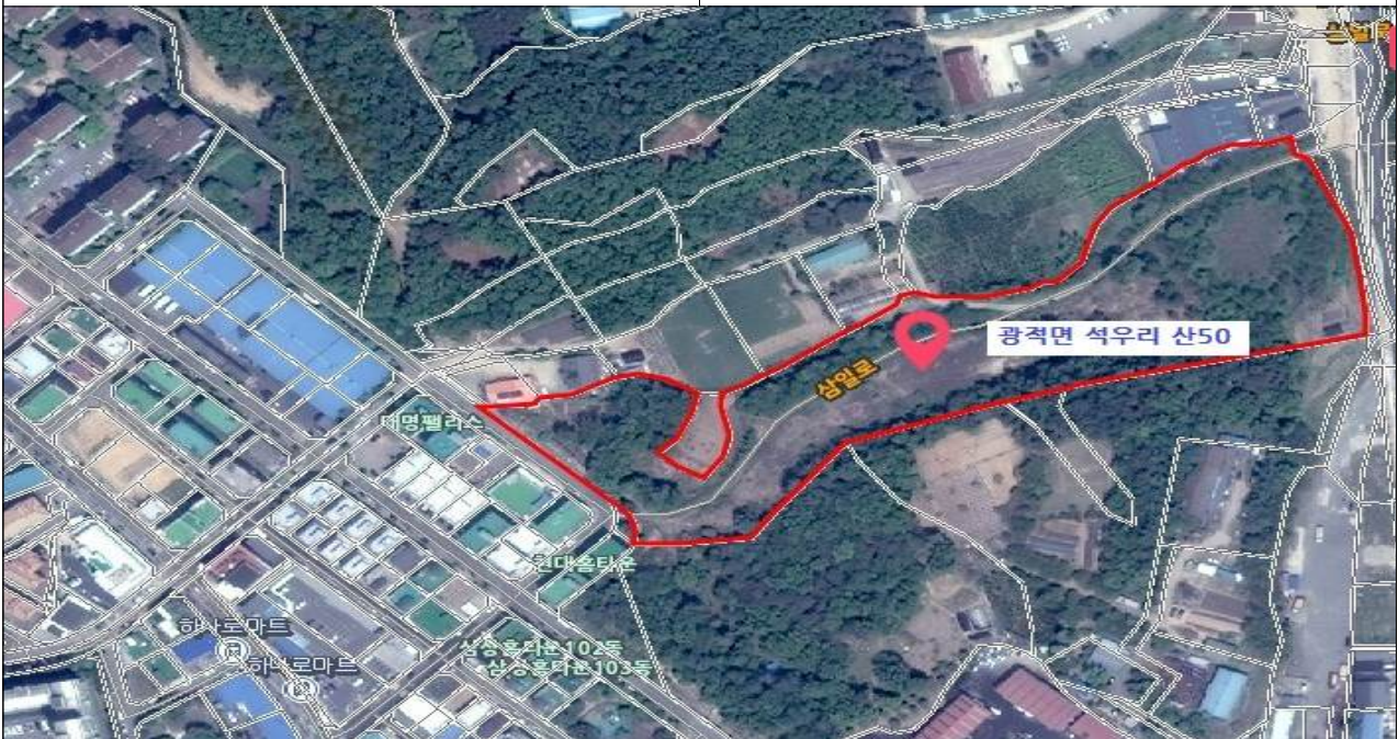
[취득] 광적면 석우리 일원(舊 26사단 신병교육대 훈련장)