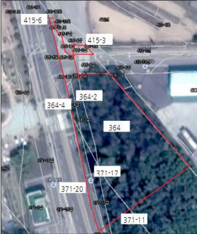
[취득] 남면 신산리 일원(25사단 舊비룡아파트부지)