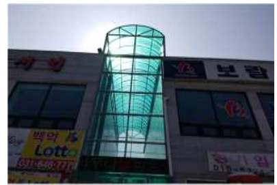
(노천탕 상부 통로)